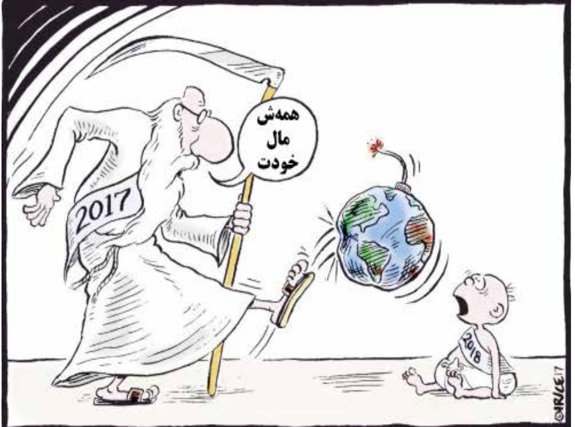
آیا امیدوی به سال جدید هست؟