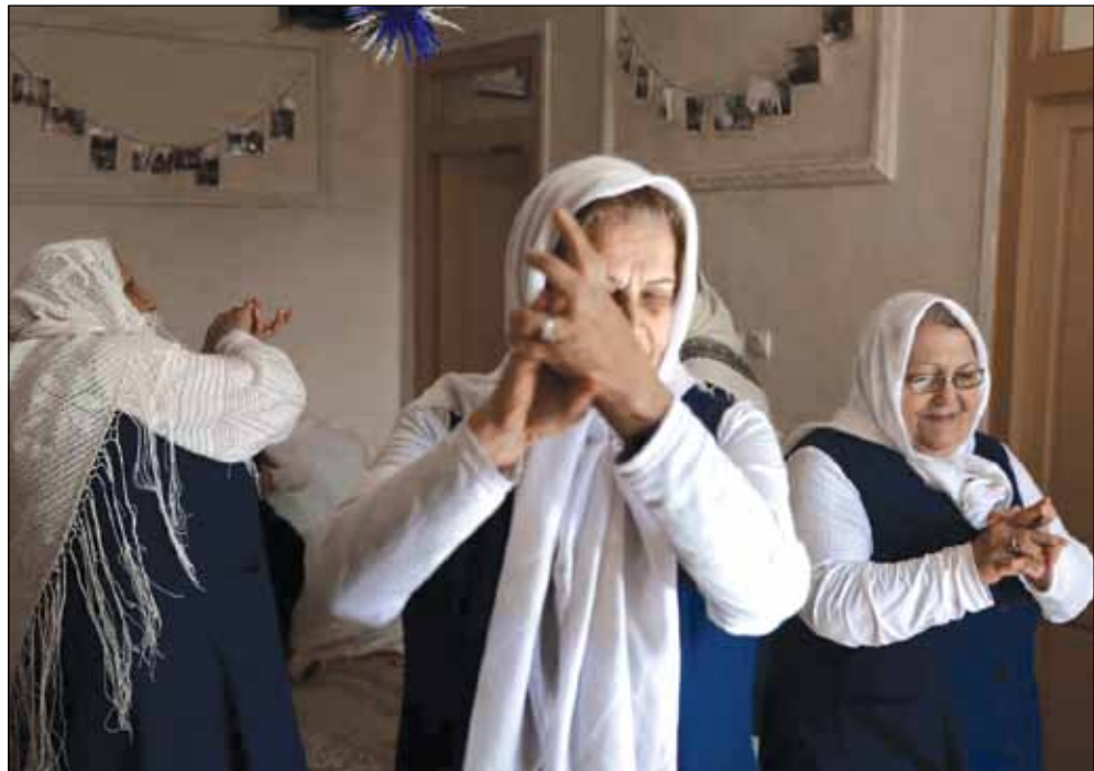
جلسه شب بیدار مرکز نگهداری سالمندان «آزمهر» در شهر بجنورد ● عکس:ها. وحید خادمی / ایرنا