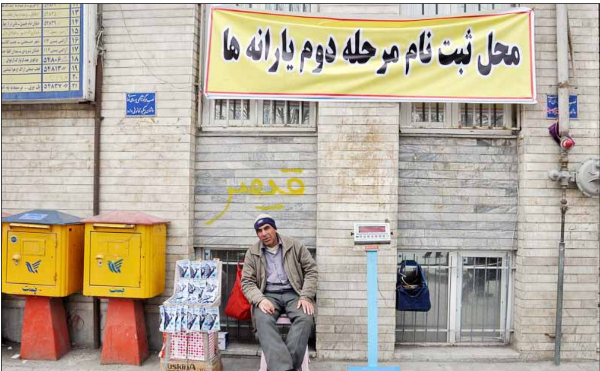
وزیر رفاه از راهکار آخر برای شناسایی ثروتمندان پرده برداشت