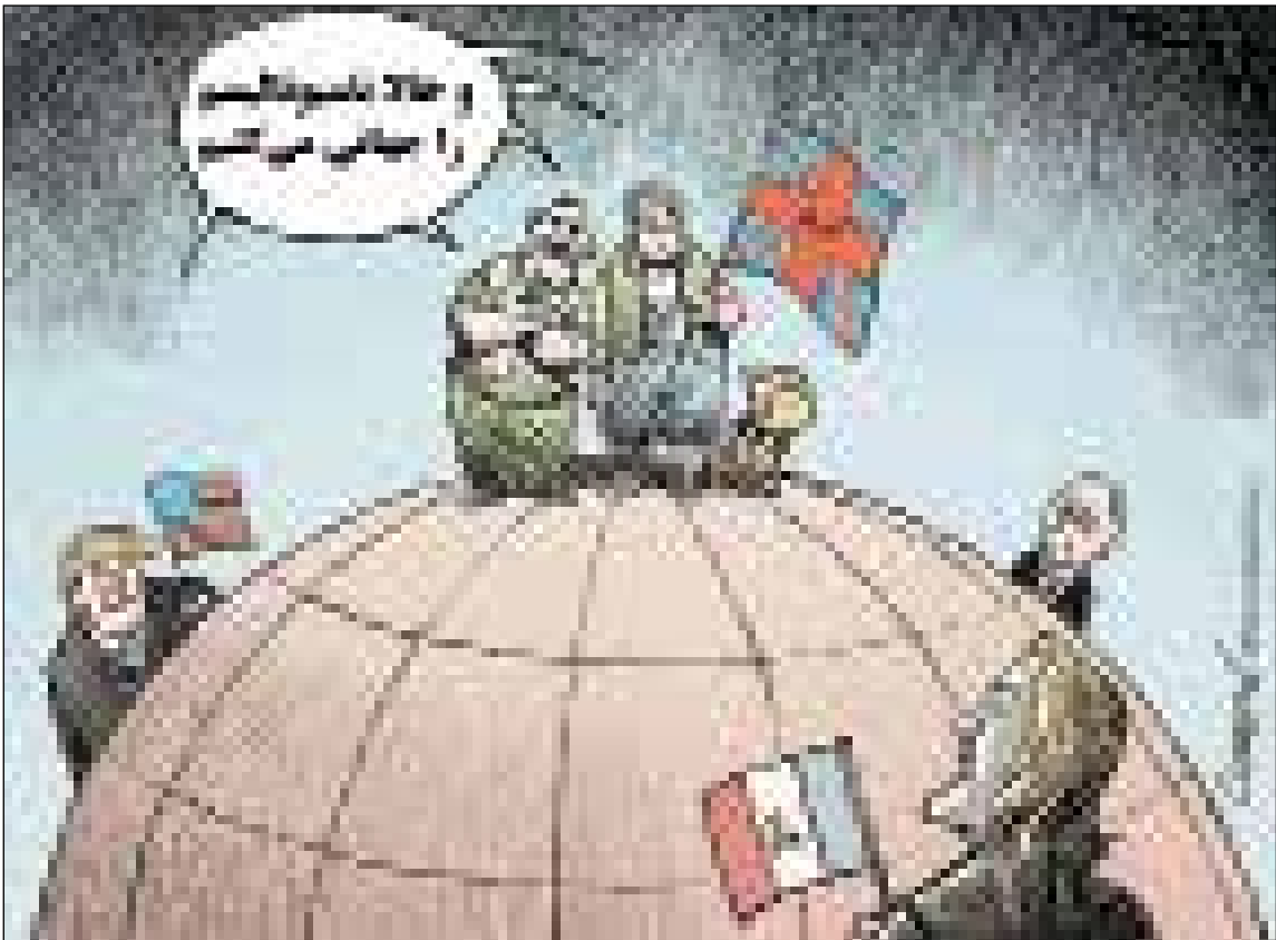
جنبش‌های ناسیونالیستی در سال ۲۰۱۷ جهان را فرا گرفت ● طراح: جاپانه / انیوپورک تایمز

● Sat, 30 Dec 2017 ● vol.1, No. 49 ● 16 Pages ● 10000 Rials