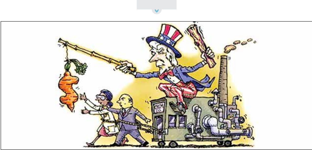
نیکی می‌گوید: کمک هابلمان را پس می‌گیریم از آنها که مخالف ما رأی دهند.